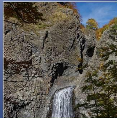
Cascade du Ray-Pic