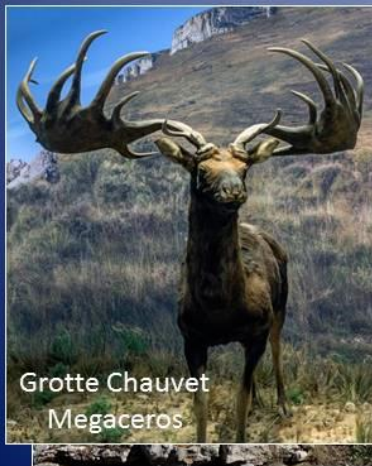
Grotte Chauvet Megaceros