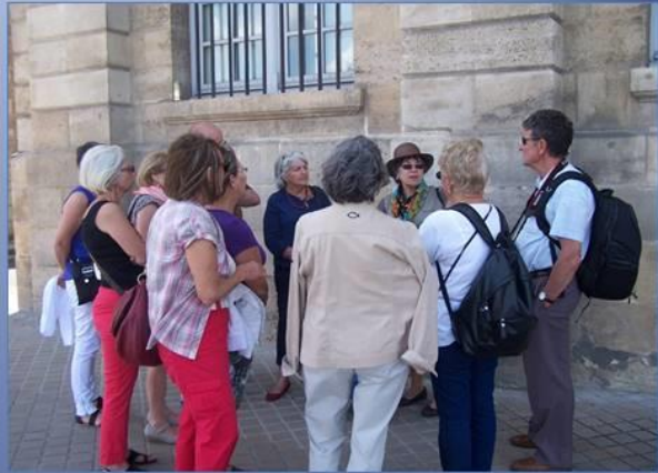
Balade dans Bordeaux