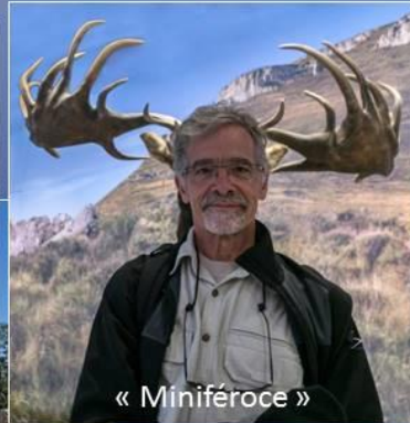
« Miniféroce »